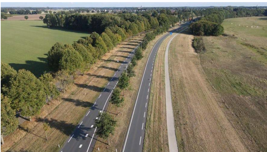
Figuur 1.1: Zicht op de provinciale weg N271 in zuidelijke richting met fietspad (en Niers) aan de rechterzijde.

De huidige Rijksweg N271 tussen de Nijmeegseweg en de Bloemenstraat ligt hoger in het landschap en vormt hier de waterkering. Bij de huidige waterveiligheidsnorm is de hoogte van de Rijksweg niet meer hoog genoeg om het achterland te beschermen. Het versterken van de huidige waterkering is nodig om te voldoen aan de wettelijke waterveiligheidsnorm. De huidige hoogte van de Rijksweg varieert van NAP +13,4 m tot NAP +14,4 m ter plekke van de rotonde. Om aan de waterveiligheidsnorm te voldoen is een kruinhoogte van NAP +14,5 m nodig. Zuidelijk van de rotonde, N271 richting Gennep is de hoogte van de Rijksweg hoger dan deze benodigde hoogte, waardoor hier geen maatregelen nodig zijn.