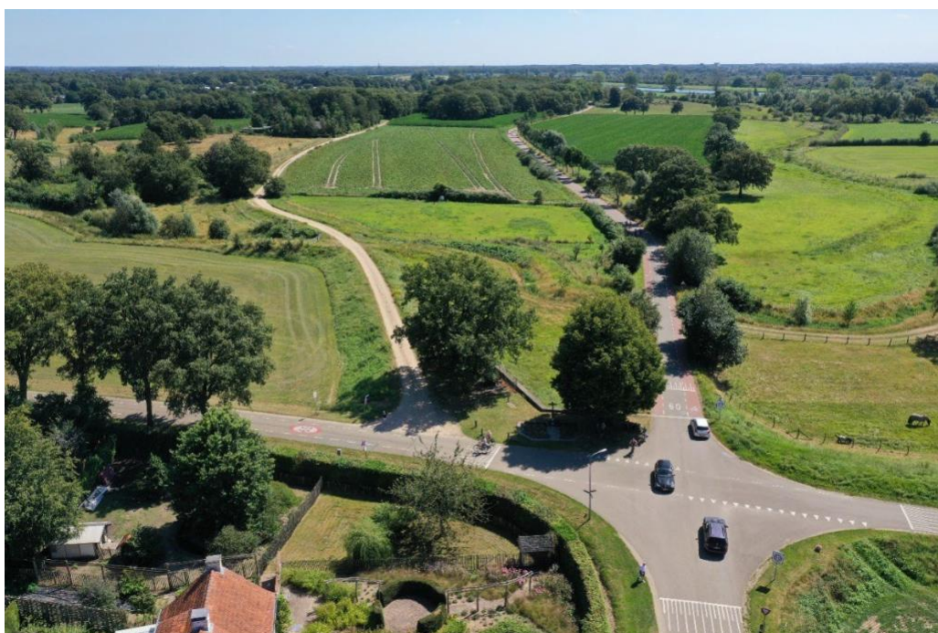
Figuur 7.1: Zicht vanaf Pastoorsdijk in oostelijke richting op de Bossebrugweg (links) en Bloemenstraat (rechts)

In de huidige situatie fungeert het meest westelijke deel van de Bossebrugweg (van Pastoorsdijk tot net oostelijk van de Tielebeek) als waterkering. Om aan de waterveiligheidsnorm te voldoen is een kruinhoogte van NAP +14,2 m nodig. In het dal van de Tielebeek zijn extra maatregelen noodzakelijk om piping te voorkomen en moet de duiker vervangen worden.