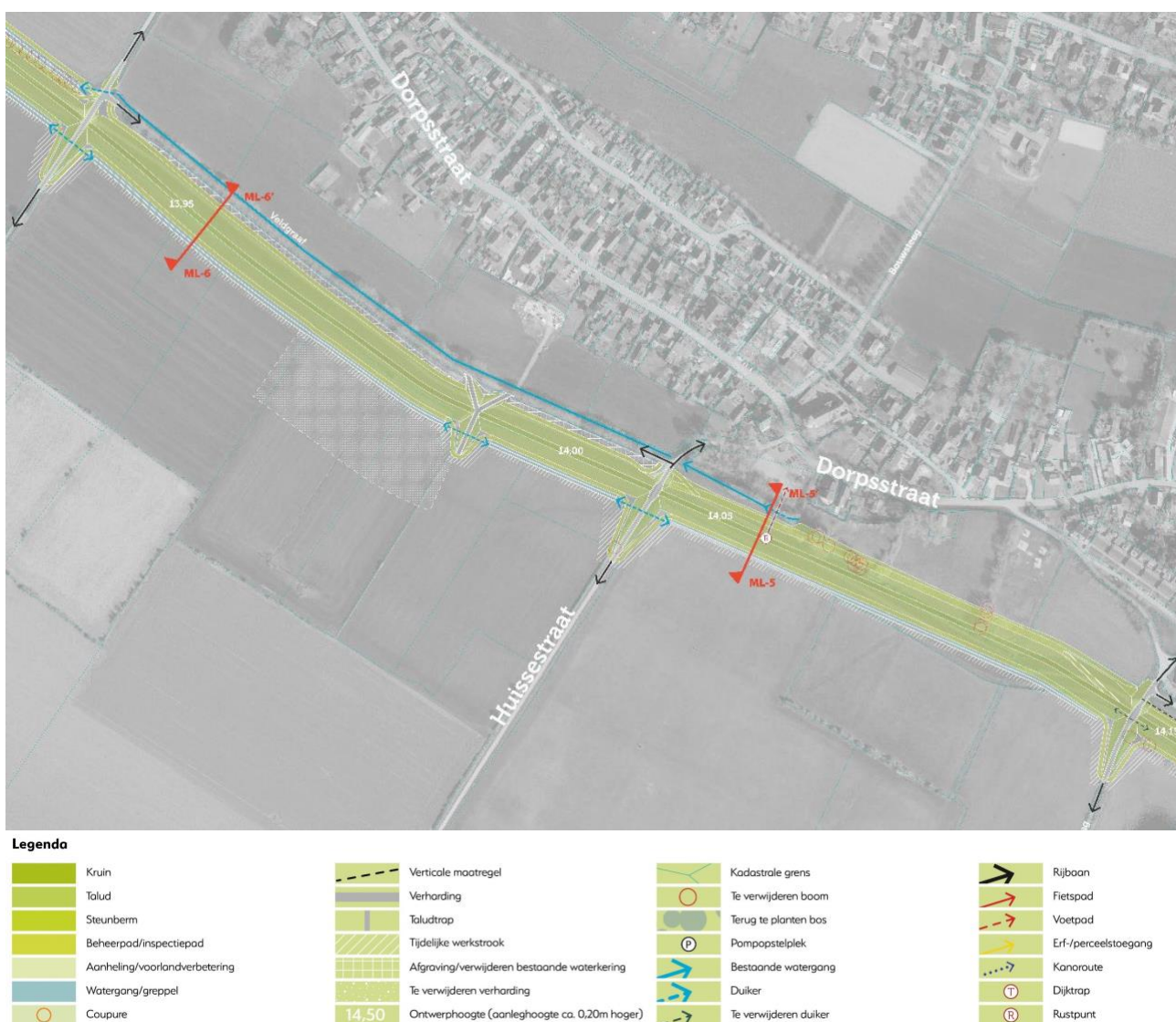
Figuur 2.1: Overzichtskaart maatregelen dijktracé Kopsesweg – Fuikstraat

Om de buitendijkse versterking bij de Broekstraat te compenseren wordt ten oosten van de Huissestraat richting de Kopsesweg de dijk iets teruggelegd. Daarmee komen we hier tot een logischer tracé waardoor tevens de knik in het huidige tracé westelijk van de Kopsesweg grotendeels verdwijnt.