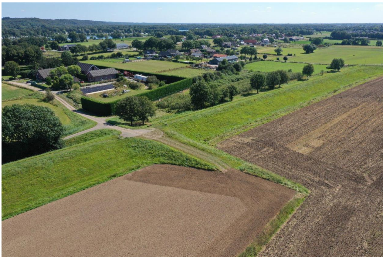
Figuur 3.2: Agrarische dijkovergang in verlengde Koningsbeemdweg die vervalt.

In de huidige situatie ligt parallel aan de dijk de onverharde Koningsbeemdweg waarlangs twee agrarische dijkovergangen liggen voor de ontsluiting van buitendijs percelen. Na afstemming met grondeigenaren en pachters wordt hiervan alleen de meest westelijke teruggebracht. Ter plekke waar de Koningsbeemdweg haaks op de dijk komt vervalt de agrarische dijkovergang (zie Figuur 3.2).