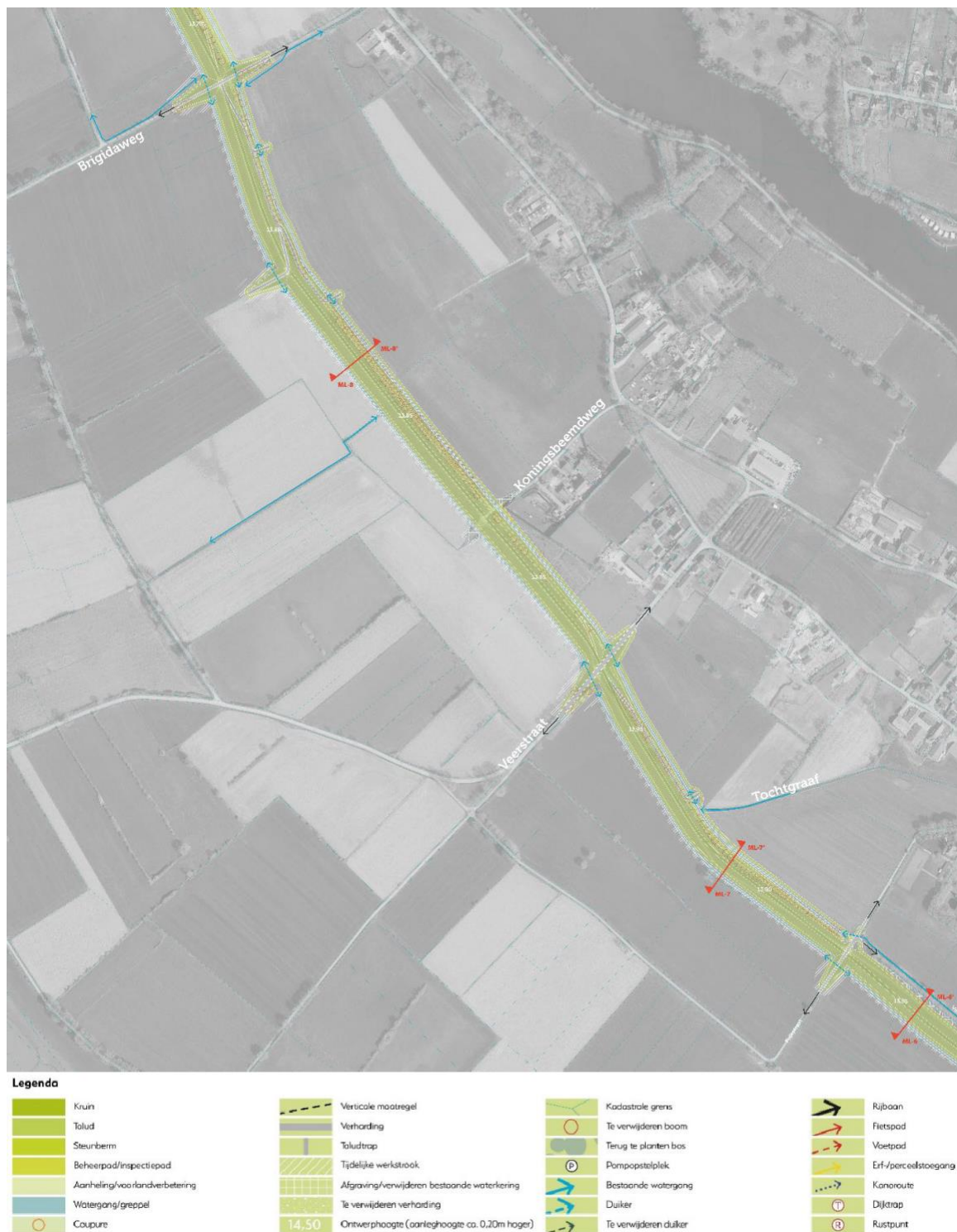
Figuur 3.1: Overzichtskartaat maatregelen dijktracé Fuikstraat – Brigidaweg

In Figuur 3.1 is een overzichtskartaat opgenomen met maatregelen in het dijktracé Kopsesweg-Fuikstraat. Om de buitendijkse versterking bij de Broekstraat te compenseren wordt ten westen van de Fuikstraat richting de Veerstraat de dijk iets teruggelegd. Daarmee komen we hier tot een vloeiender tracé.